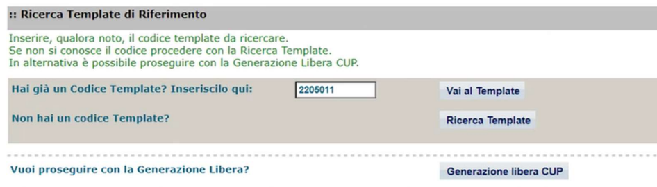
Fig. 1 – Inserimento del Codice Template