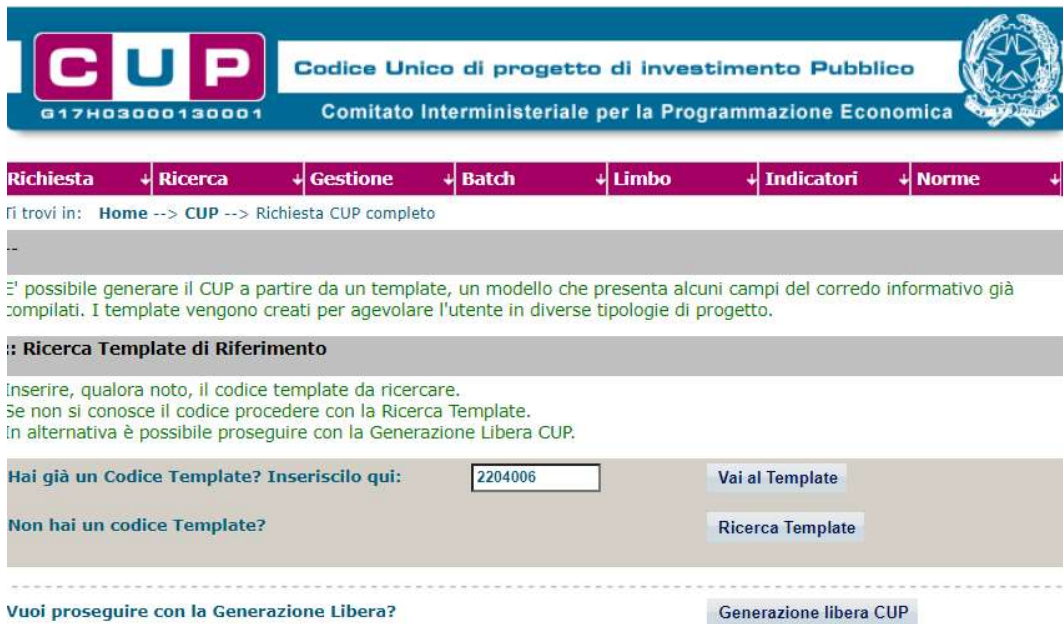
Fig. 1 – Inserimento del Codice Template