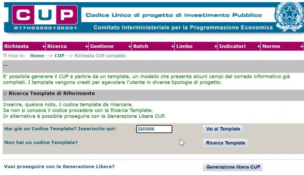
Fig. 1 – Inserimento del Codice Template

STEP 3. Seguire la procedura di generazione guidata compilando le schermate nell'ordine previsto.