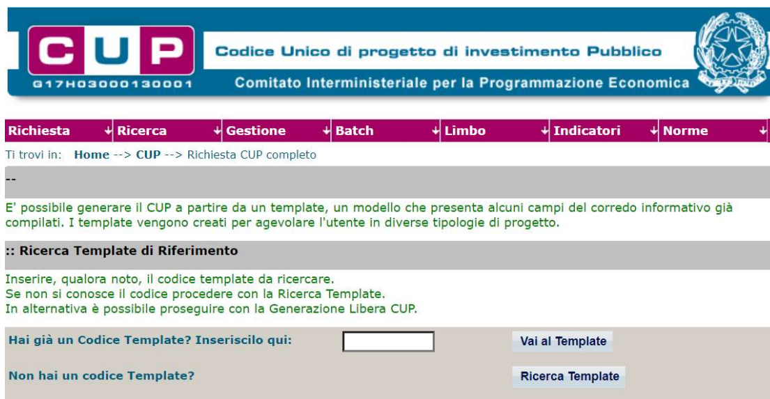
Fig. 1 – Inserimento del Codice Template

STEP 3. Seguire la procedura di generazione guidata compilando le schermate nell'ordine previsto.