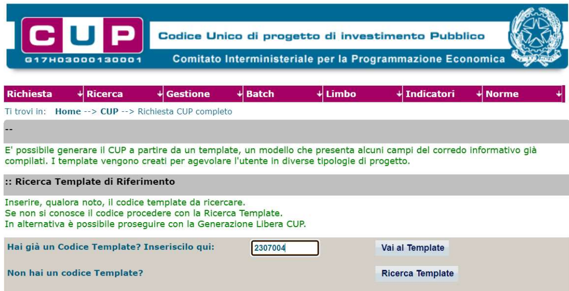
Fig. 1 – Inserimento del Codice Template

STEP 3. Seguire la procedura di generazione guidata compilando le schermate nell'ordine previsto.